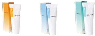
クレンジング ウォッシング クリアパック