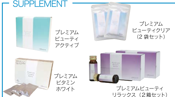
プレミアム ビューティ アクティブ