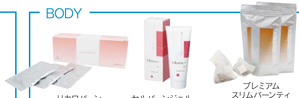
リカロバーン セルバーンジェル プレミアム スリムバーンティ (2点セット)