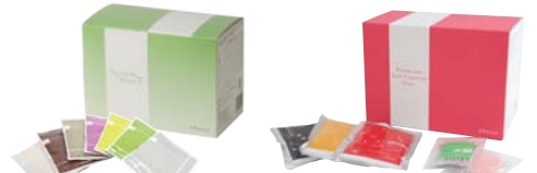
システムダイエット7 プレミアム セルフコントロールダイエット