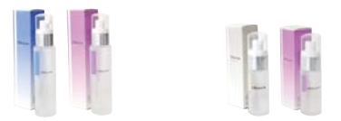
ローション (A/M) ソリューション (W/M)