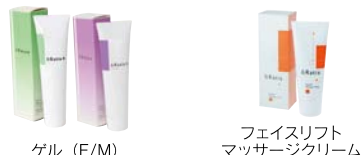
ゲル (E/M) フェイスリフト マッサージクリーム