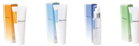
クレンジング ウォッシング ローション A ゲル E