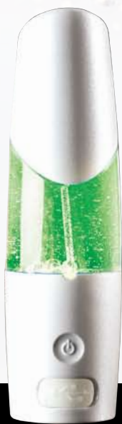
Aqua Silion Mist

生成時間 180秒/360秒 製品重量 266.6g 寸法 直径 7.61cm 高さ 21.2cm 内容量 350mL